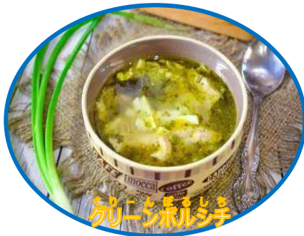
カリコシホリスシ