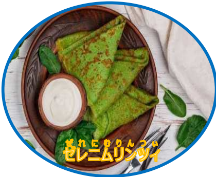
ゼレニムリンツィ